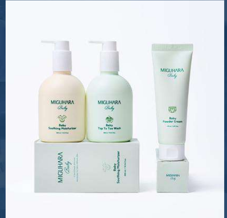
미구하라 베이비 3종