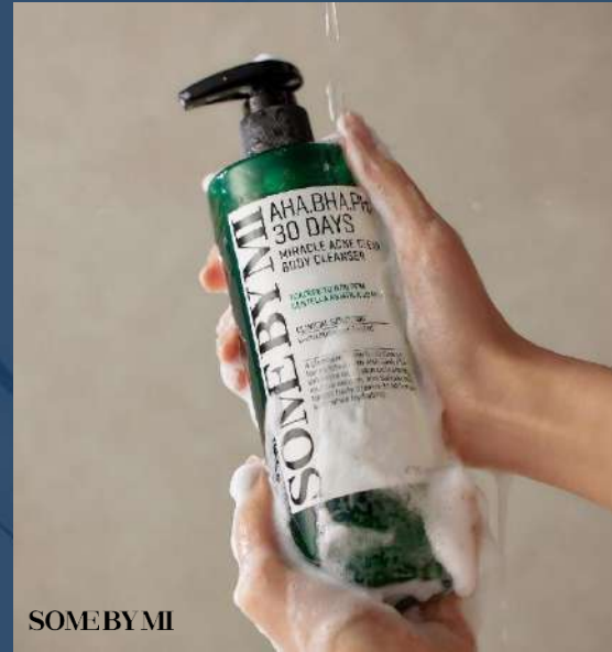
SOME BY MI 썸바이미 미라클 아크네 클리어 바디 클렌저