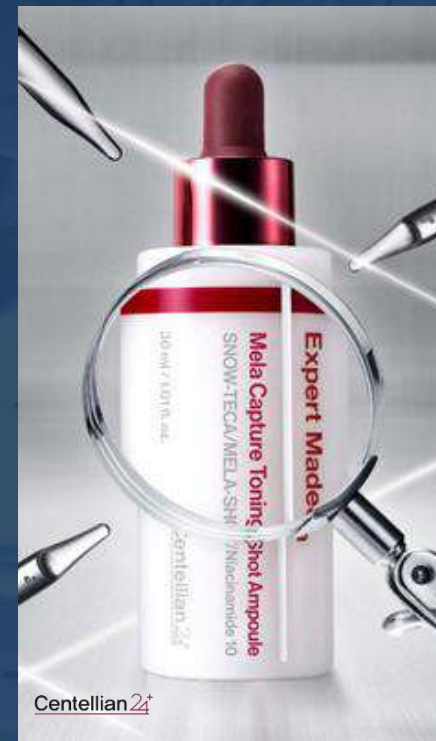
센텔리안24 마데카 멜라캡처 토닝샷 앰플