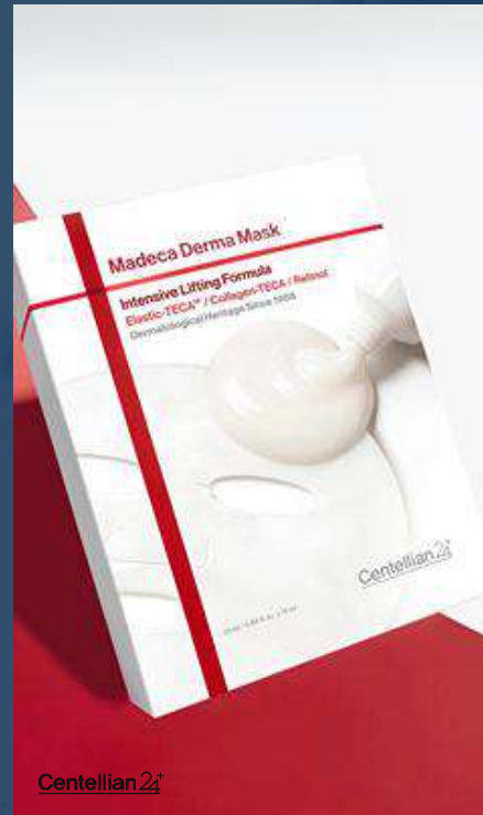
센텔리안24 마데카 인텐시브 리프팅포뮬러 더마 마스크