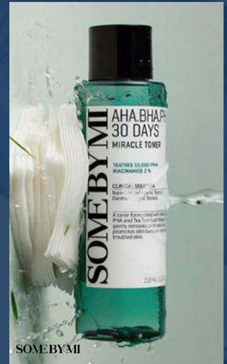
썸바이미 아하바하파하 30 데이즈 미라클 토너