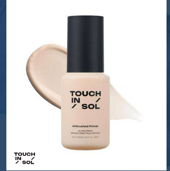
TOUCH IN SOL 터치인솔 브러쉬드 프라이머