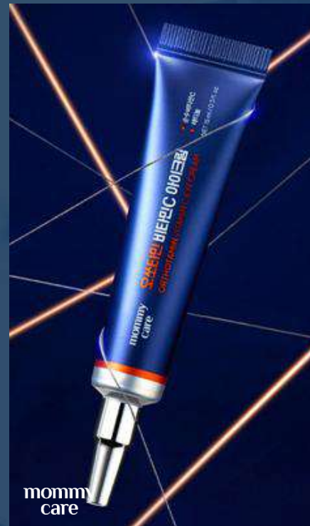
마미케어 오쏘타민 비타민C 아이크림