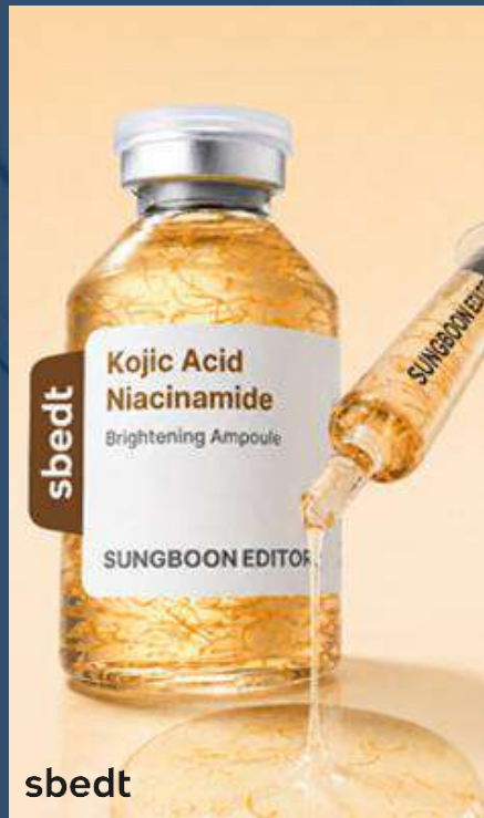
성분에디터 코직산 나이아신아마이드 앰플