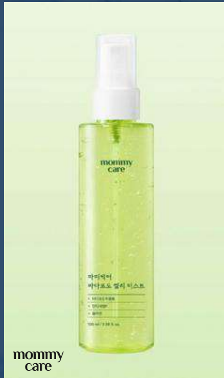
마미케어 바다포도 젤리 미스트