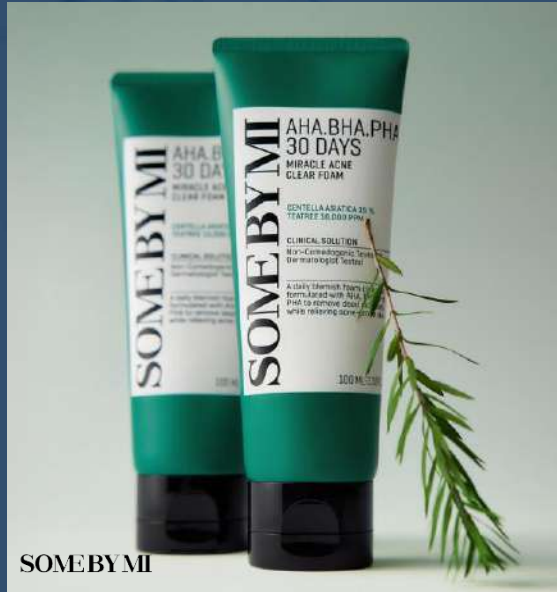
SOME BY MI 썸바이미 미라클 아크네 클리어 폼