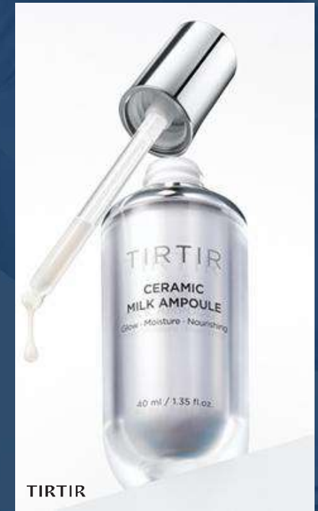
티르티르 도자기 밀크 앰플