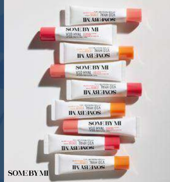
SOME BY MI 썸바이미 브이텐 히알 립 선 프로텍터 Broad Spectrum