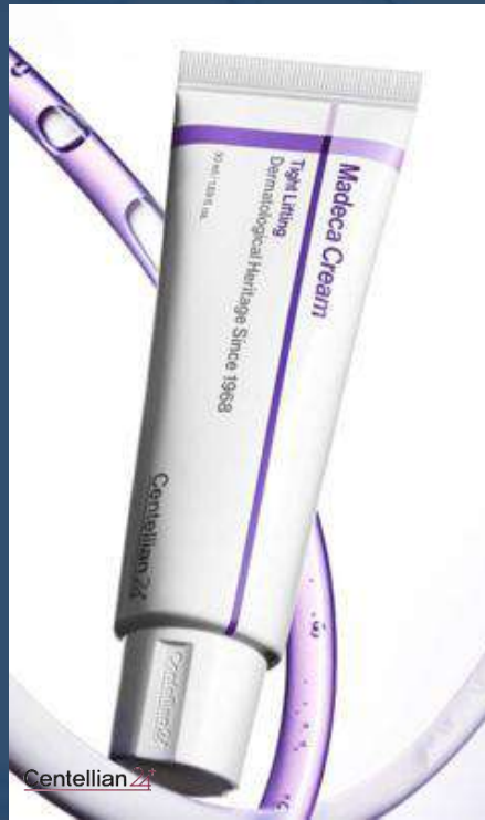
센텔리안24 마데카크림 타이트 리프팅