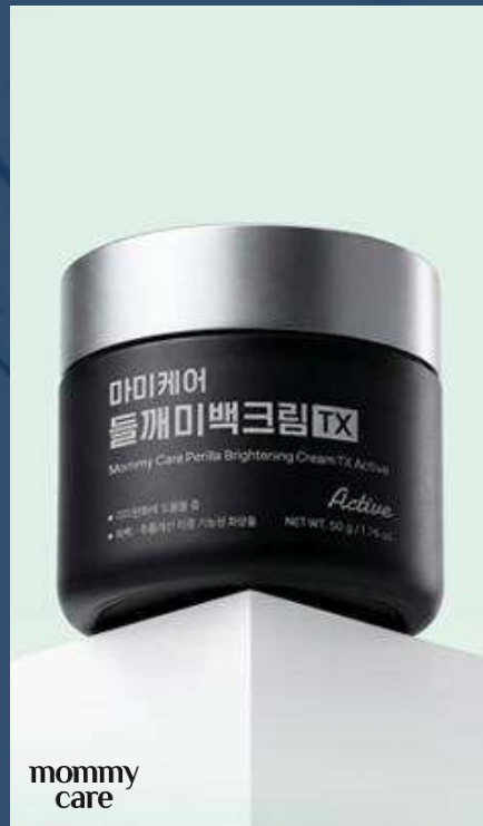
마미케어 들깨미백크림 TX 플러스 크림