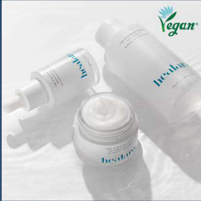
힐아라 래디언스 샷 3종