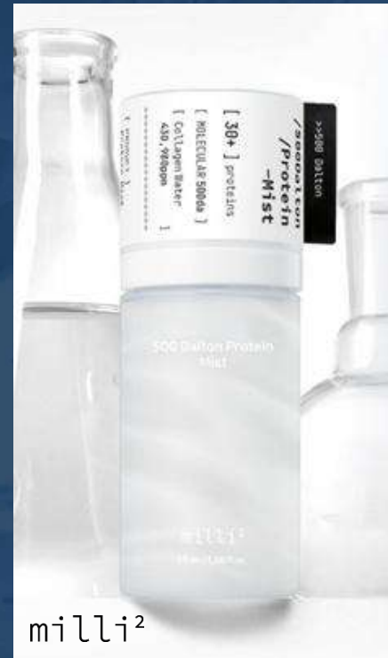
밀리밀리 500달톤 프로틴 오로라 미스트