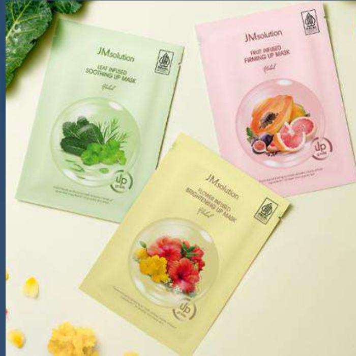
제이엠솔루션 마스크 팩 3종